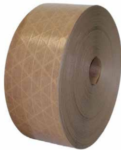
Nasskleberolle Max Gitterverstärkt

Für das staubdichte, manipulationssichere und umweltfreundliche Verschließen von Kartonagen aller Gewichtsklassen stellen wir Ihnen verschiedene Nassklebebänder zur Verfügung. Neben unverstärkten Klebestreifen nach DIN 55475 bieten wir Ihnen auch fadenverstärkte und faserverstärkte Klebebänder. Das optimale Nassklebeband bietet eine hohe Anfangsklebekraft und eine gute Reißfestigkeit. Wir haben für jeden Anwendungsfall das passende Nassklebeband im Sortiment.