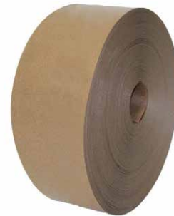
Nasskleberolle Basis Ohne Verstärkung