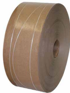
Nasskleberolle Plus Fadenverstärkt