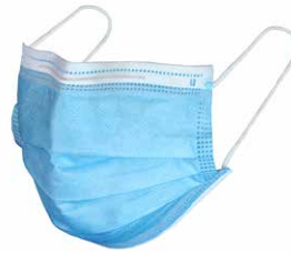
Abb. ähnlich | Art.: 86-001342

Je nach Verfügbarkeit auch in schwarz lieferbar.