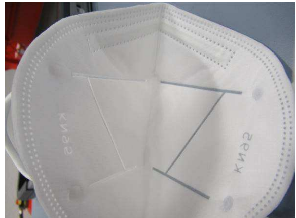
Innenansicht / Inner view