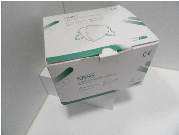
Verpackung / Packaging