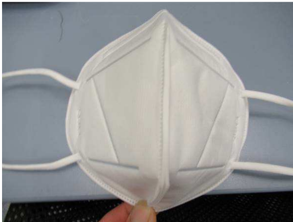
Frontansicht / Front view