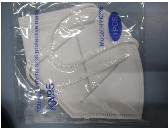
Verpackung / Packaging

Die folgende Maske wurde geprüft / The following mask was tested: