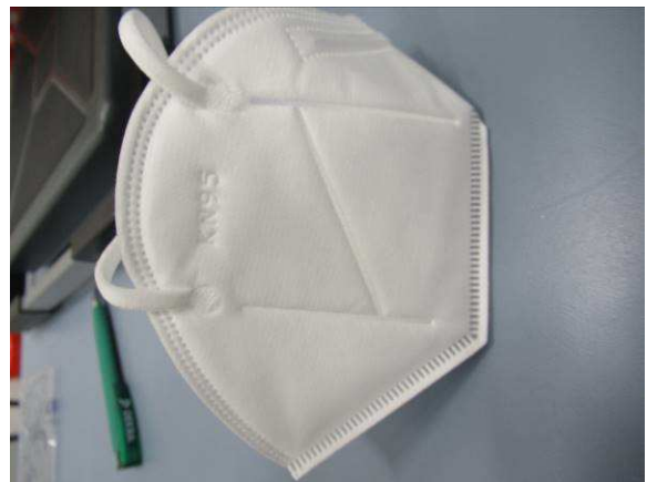
Seitenansicht / Side view